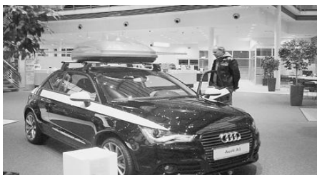
图为一名德国顾客在柏林的一家奥迪专卖店中选购奥迪A1。

两则来自中国的新闻近日受到德国汽车行业的关注：一是奥迪汽车公司去年在中国的销量首次超过本土；二是中国政府在《外商投资产业指导目录》中将投资整车制造的条目从鼓励条目中删除。德国汽车行业协会以及一些专家学者在接受本报记者采访时表示，中国市场对德国汽车厂商意味着重大商机，也为欧债危机下的欧洲经济发挥着稳定器作用。2012年中国促进世界经济稳定的趋向不会改变，德国厂商继续投资中国的战略也不会改变。